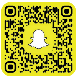
MPT DE LA CHAMBERLIÈRE