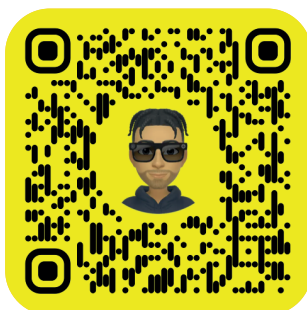
MPT DU CENTRE-VILLE