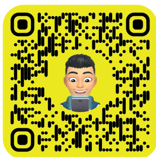
MPT DU PLAN