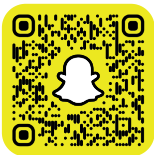
MPT DE FONTBARLETTES

Retrouvez toutes les actualités des MPT sur Snapchat en flashant les QR codes ou sur le site valence.fr/equipement