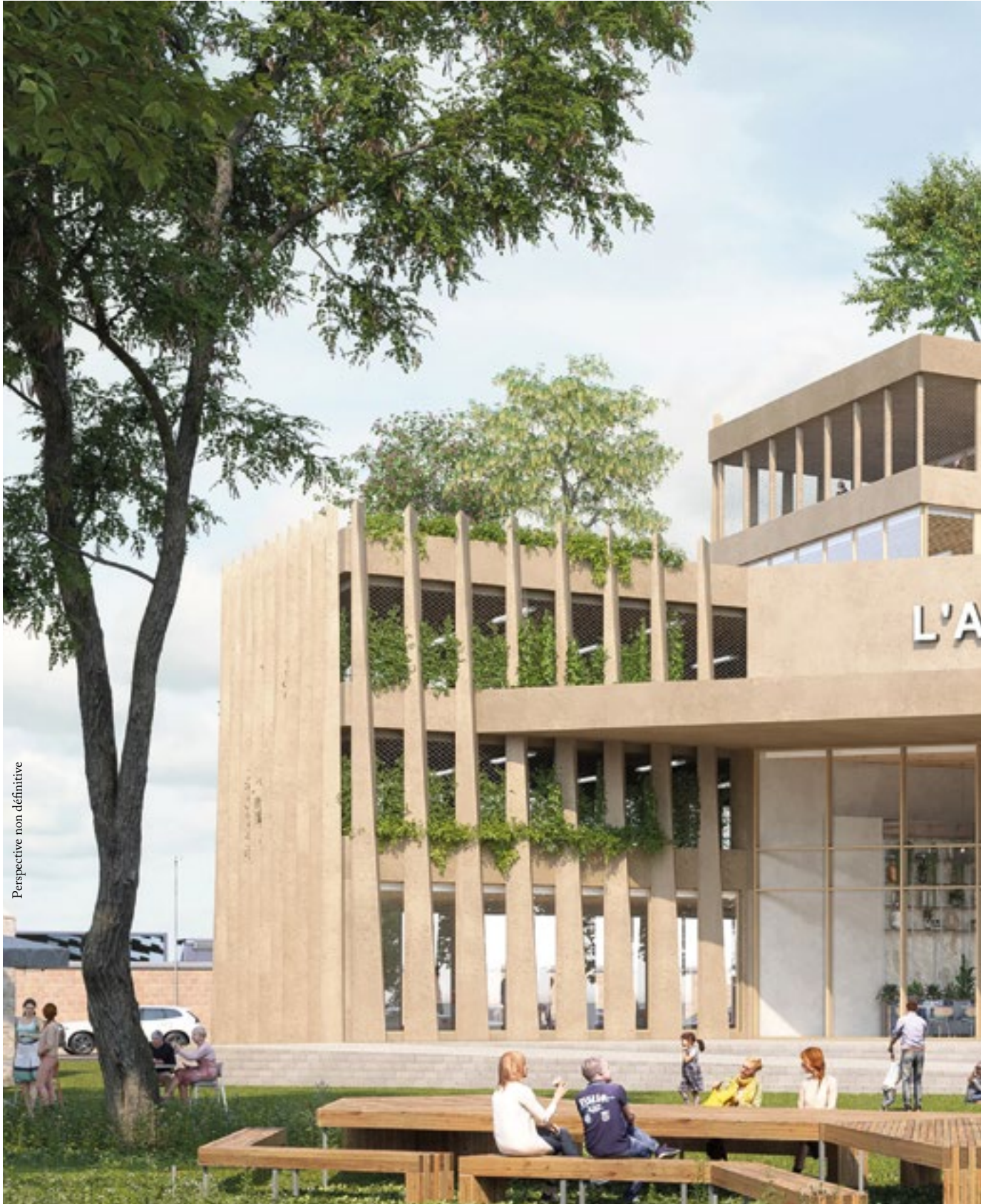
Perspective non définitive