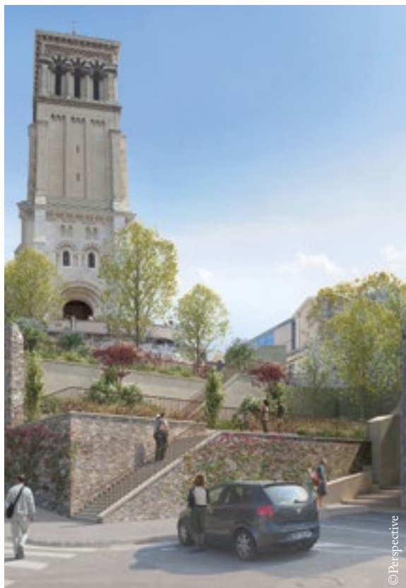
La Ville prévoit la construction d'un escalier serpentant entre des jardins suspendus pour relier la basse-ville et le centre-ville (perspective).

En plus de ces projets privés, la Ville investit fortement dans le quartier. À l'automne 2019, une halte fluviale a vu le jour près du parc Jouvet. Le tracé de la ViaRhôna, voie cyclable reliant le lac Léman à la Méditerranée, a été entièrement modifié : en provenance de Bourg-lès-Valence, il emprunte les rues en cours de réaménagement de la basse-ville, longeant notamment les futures Halles gourmandes et le parc Jouvet avant de rejoindre l'Épervière. Le tracé définitif devrait être entièrement ouvert aux cyclotouristes début 2024. Avenue du Tricastin, la voirie va être modifiée pour fluidifier le trafic et sécuriser les cheminements piétonniers. Pour relier la basse-ville au centre-ville, la municipalité avait envisagé la création d'un ascenseur urbain. Le projet a été abandonné car il présentait le double inconvénient d'être très coûteux et de dénaturer les lieux, la cathédrale Saint-Apollinaire étant toute proche. Les deux quartiers seront finalement reliés par un escalier serpentant entre plusieurs jardins suspendus... un projet pensé dès 1849 par l'architecte Antoine-Nicolas Bailly. ■