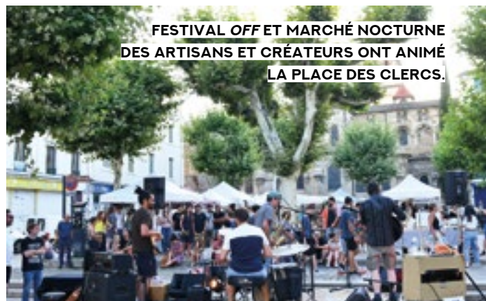
FESTIVAL OFF ET MARCHÉ NOCTURNE DES ARTISANS ET CRÉATEURS ONT ANIMÉ LA PLACE DES CLERCS.