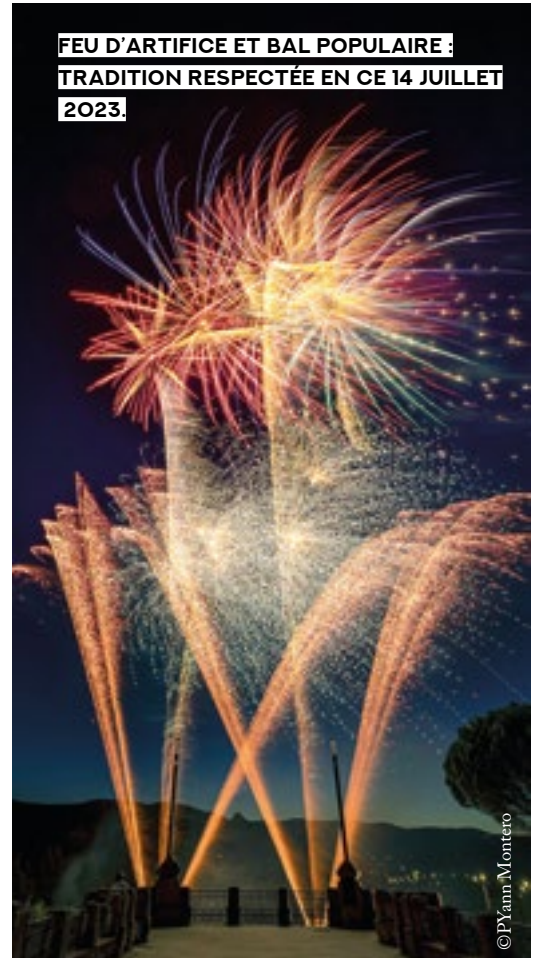
FEU D'ARTIFICE ET BAL POPULAIRE : TRADITION RESPECTÉE EN CE 14 JUILLET 2023.

À LA BOURSE DU TRAVAIL, A TROUVÉ SON PUBLIC, TOUT COMME L'UNIVERS SANS L'HOMME, À DÉCOUVRIR AU MUSÉE JUSQU'AU 17/09