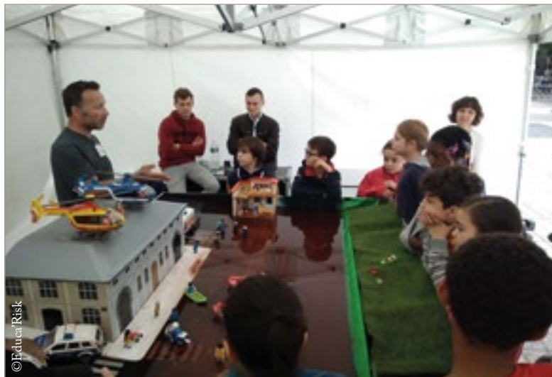
La maquette Educa'Risk inondation sera présentée aux visiteurs dans le cadre du Village des sciences, le 14 octobre, à Latour-Maubourg.

_____Orages de grêle, mini tornades, pluies torrentielles, canicule... Valence, tout comme l'ensemble de la France, est susceptible d'être frappée par des phénomènes naturels extrêmes. Or, nous n'avons pas encore acquis cette "culture du risque" essentielle pour faire face au mieux à des épisodes climatiques de plus en plus intenses.