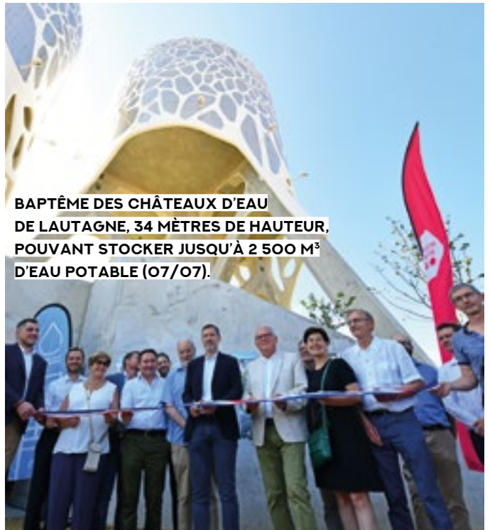
BAPTÊME DES CHÂTEAUX D'EAU DE LAUTAGNE, 34 MÈTRES DE HAUTEUR, POUVANT STOCKER JUSQU'À 2 500 M 3 D'EAU POTABLE (07/07).