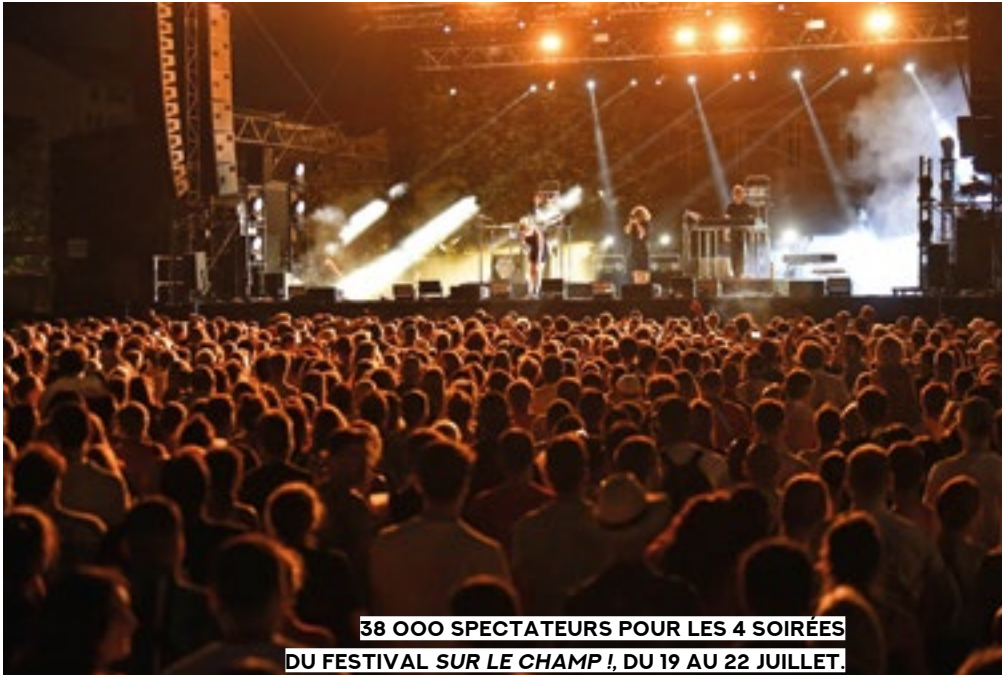
38 000 SPECTATEURS POUR LES 4 SOIRÉES DU FESTIVAL SUR LE CHAMP I, DU 19 AU 22 JUILLET. UN FESTIVAL GRATUIT, ÉCLECTIQUE ET POPULAIRE, ORGANISÉ PAR LA VILLE SUR LE CHAMP DE MARS.