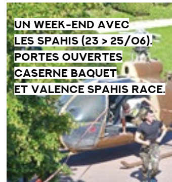
UN WEEK-END AVEC LES SPAHIS (23 > 25/06). PORTES OUVERTES CASERNE BAQUET ET VALENCE SPAHIS RACE.