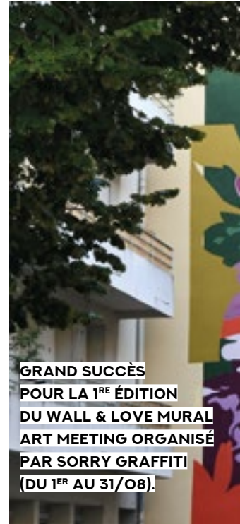
GRAND SUCCÈS POUR LA 1 RE ÉDITION DU WALL & LOVE MURAL ART MEETING ORGANISÉ PAR SORRY GRAFFITI (DU 1 ER AU 31/08).