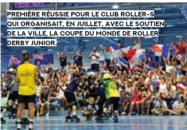
PREMIÈRE RÉUSSIE POUR LE CLUB ROLLER-S QUI ORGANISAIT, EN JUILLET, AVEC LE SOUTIEN DE LA VILLE, LA COUPE DU MONDE DE ROLLER DERBY JUNIOR.