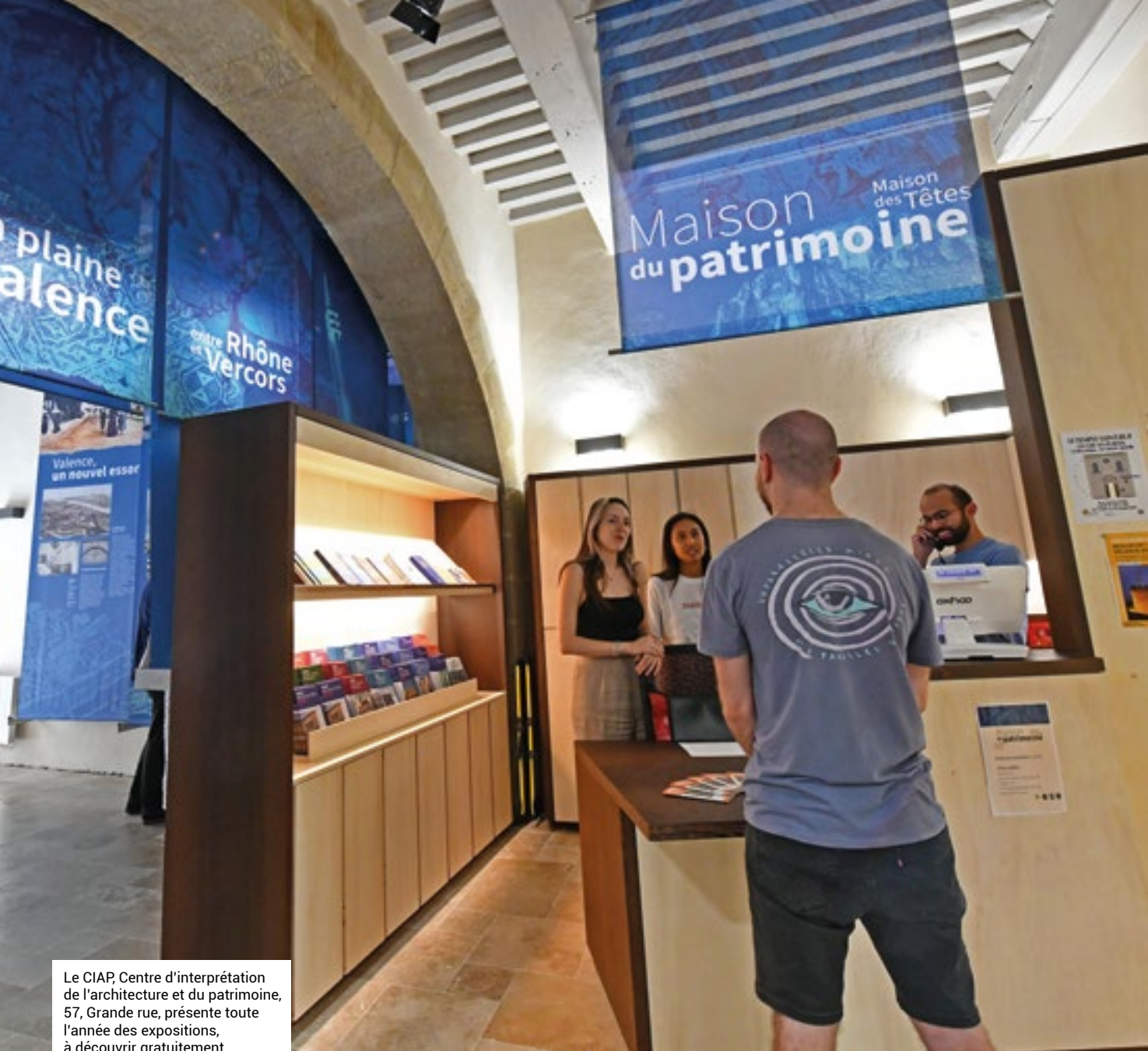
Le CIAP, Centre d'interprétation de l'architecture et du patrimoine, 57, Grande rue, présente toute l'année des expositions, à découvrir gratuitement.